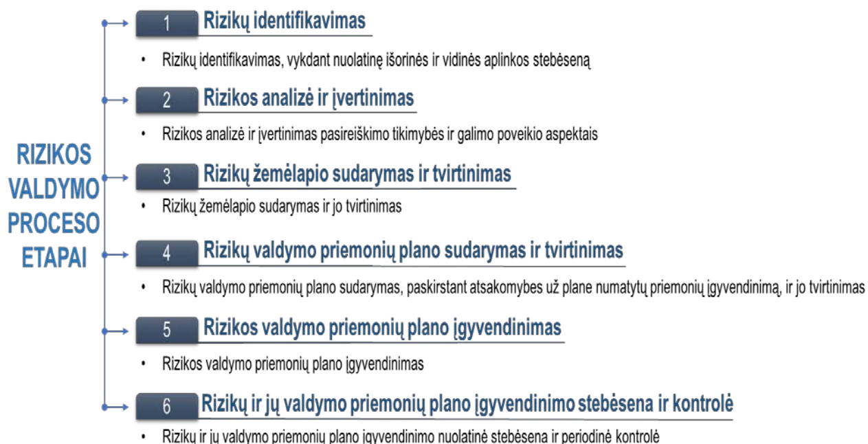
1 pav. Rizikos valdymo procesas

4.1. Rizikos valdymo procesas pateiktas 1 paveiksle.